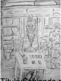
Título: Sabiendo del futuro