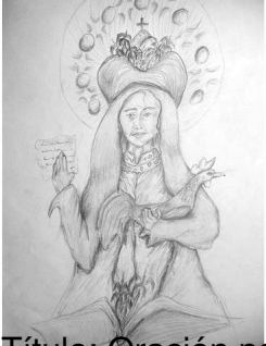
Título: Oración para un gallo